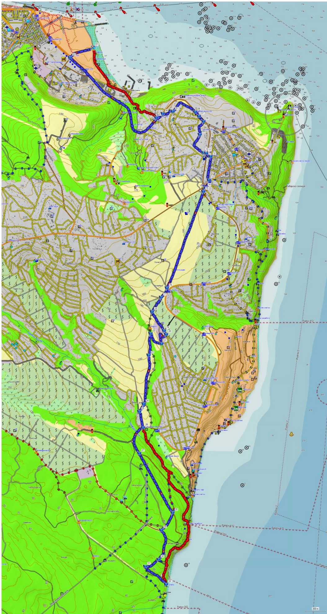
Картата е базирана върху BG Mountains / kade.si