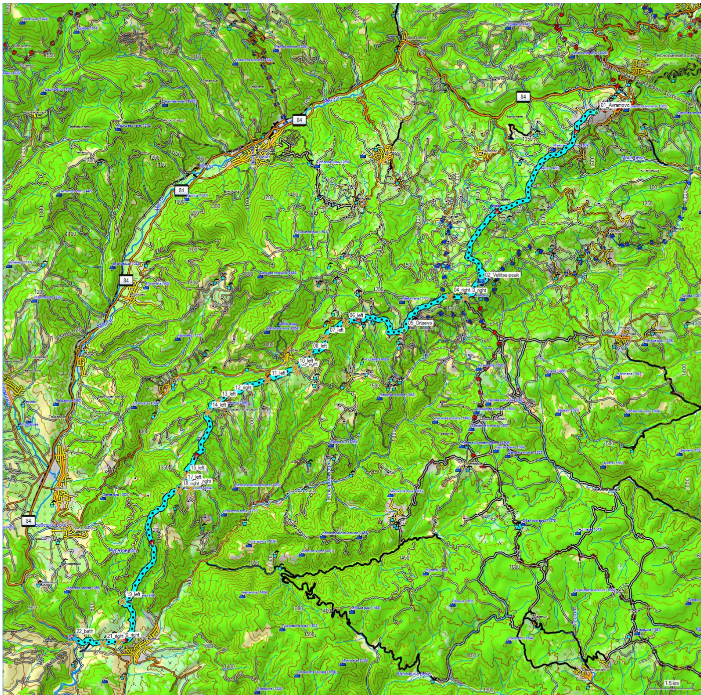
Картата е базирана върху BG Mountains / kade.si